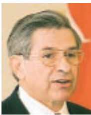
VARDER. Paul Wolfowitz.

det Chirac bruker, men vet ikke om det var ham. Foreløpig vet de lite om hva som har skjedd, hvem som er kommet. De vet ikke at det er 126 deltagere og at 122 av dem er menn. Fire er kvinner, og halvparten av de fire er dronninger. Men det er det ennå ingen som vet. Det er heller ingen som er riktig sikker på at den norske sentralbanksjefen kom klokken to, men det kunne ligne på ham. Det lignet på Svein Gjedrem, har de fått høre.