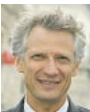
VARDER. Dominique de Villepin.

De går. BBC blir med. De skal intervjuer Tucker. Så er det middag.