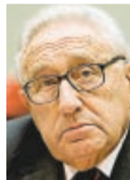
VAR DER. Henry Kissinger.

Det eneste offisielle notatet som er sendt ut,