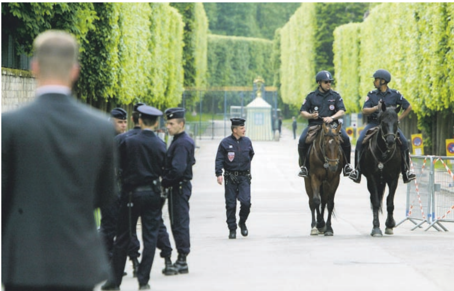
KLASSEBESKYTTELSEN. Når verdens mektigste menn møtes i dyp hemmelighet, kommer politiet. Over hundre bevæpnede politifolk patruljerte på strategiske steder utenfor hotellet. I tillegg var området rundt hotellet fullt av sivilkledde spanere. Forbipasserende ble jaget vekk.