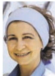
VAR DER. Dronning Sofia av Spania.

er en pressemelding som ble skrevet før konferansen begynte. Den sier litt om hva Bilderberg er for noe, og at alt som skjer der er strengt hemmelig. Til og med på vedlegget til «pressemeldingen» står det «strictly confidential» øverst i hjørnet.