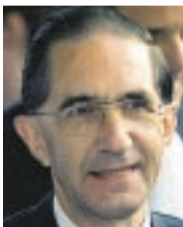
VARDER. Willy Claes.

Verdenspressen. Innenfor murene sitter verdens mektigste menn. Utenfor veksler 13 menn på å holde utkikk, slik at de kan rapportere hjem. To tyrkiske reportere, fire konspirasjonsteoretikere, tre unge franskmenn fra Indymedia, to BBC-reportere og Dagens Næringsliv fra Norge.