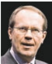
VARDER. Jorma Ollila.

– Hvis du sier at du så ham, så gjorde du vel det. Men han er der bare som gjest!