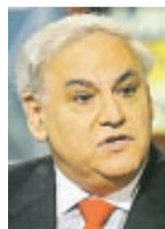
VAR DER. Richard Perle.